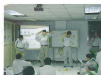
桃南廠背負式安全帶佩帶比賽