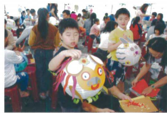
▲ 小弟弟對動物特別偏愛

為與地方鄉親營造良好的互動關係，秉持企業倫理和做好鄰居的經營理念，舉辦每年一次大型活動是本廠主要的例行工作之一。今年舉辦「點亮希望」燈籠彩繪比賽；在焚化廠前面綠地舉辦燈籠彩繪創作，藉以促進親子關係，並讓鄉親認識焚化廠不但解決垃圾問題，而且擁有優質的環境。