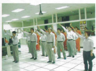
烏日廠 東廠長帶領同仁宣示

今年度工安週活動重點工作項目之一為工作安全分析(Job Safety Analysis)與關懷合作精神，藉由互動、討論與分享模式，建立同仁危害預知與分析的觀念與態度，以採取防範措施達到風險管理之目的。並將評估結果透過相互呼喚與提醒的實際演練方式加深同仁的印象，凝聚同仁間主動互護與監護的文化。