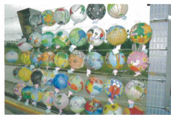
▲ 作品個個都有冠軍相