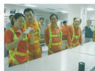
苗栗廠工安學堂搶答活動