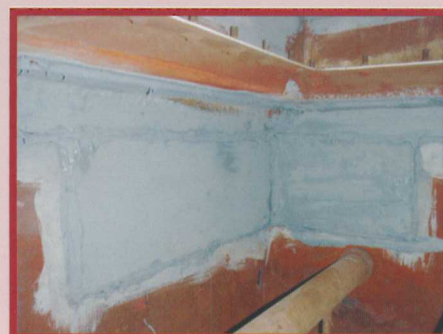
▲圖2.袋室補板焊補三道程序(焊補、耐熱矽利康、耐熱漆)