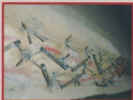
▲圖1.過熱器集氣管植釘補強

最後在二轉三煙道上的集汽管，常常也會有耐火掉落的風險若是耐火物掉落會使過熱器轉閘卡異物跳脫影響廢棄的流動，為了以防萬一特地在這次的二轉三煙道集氣管部份，加強了耐火值釘的焊補，樣式如圖1。