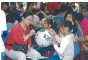
▲ 參賽隊伍認真且溫馨的畫面

由於戶外的大型活動最擔心的事乃當天下雨，惟預訂的時程正逢國內缺雨水，面對此情境心頭有兩難的感受，在活動開始前2~3個禮拜，馬總統求雨後，連續下了一星期「零零落落的大小雨」，我的心情就像三溫暖一樣，外面的民眾詢問電話「是否如期舉辦」？報名的民眾不踴躍？評審的燈籠何處展開？下雨時民眾要在那畫畫呢？各種因為下雨要應變的事項如排山倒海而來。