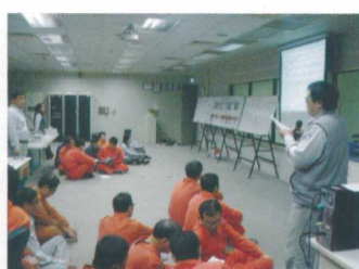
后里廠JSA工作安全分析討論分享

比較不一樣的是今年採取活潑有趣的背負式安全帶佩帶比賽以及工安學堂搶答活動，讓同仁了解安全帶的正確佩帶方式以及建立同仁基本安全衛生知識，並選出各專案中積分最高之個人，頒發「工安我最行」獎狀。