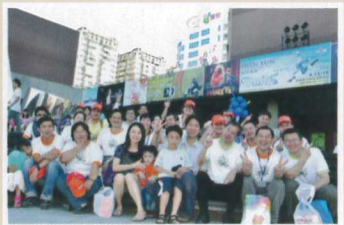
▲廖總與參與活動同仁、眷屬歡喜合照