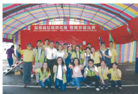
▲ 辛苦且忙得不可開交，但心滿意足的工作夥伴們