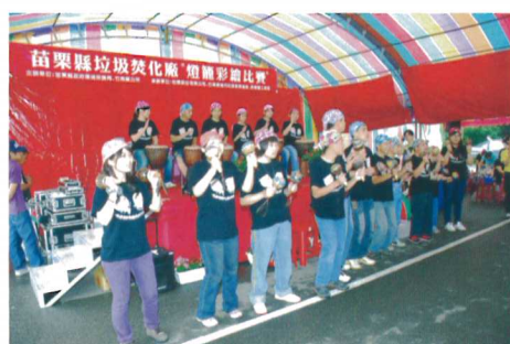
▲ 幼安教養院小朋友表演非洲鼓及舞蹈

本文要感謝信鼎、暉鼎同仁的鼎力協助，從籌劃至活動前的準備及當日從一清早到散場的辛苦，再次敬上十二萬分的謝意。有你們真好，大家一起努力，讓本廠與社區融在一起。