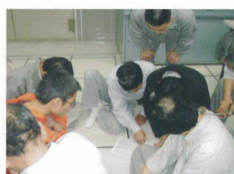
基隆廠JSA工作安全分析討論分享

在各專案的推動與全體同仁的參與下，100年度工安週活動已圓滿結束，透過本次活動，可以感受到大家對於安全衛生工作之重視與全體動員做工安之決心，看到同仁們認真執行模擬演練，進行作業風險分析，用心投入每一環節，細心叮嚀關懷，完善安全防護措施的態度，我們有信心工安工作一定會更好。