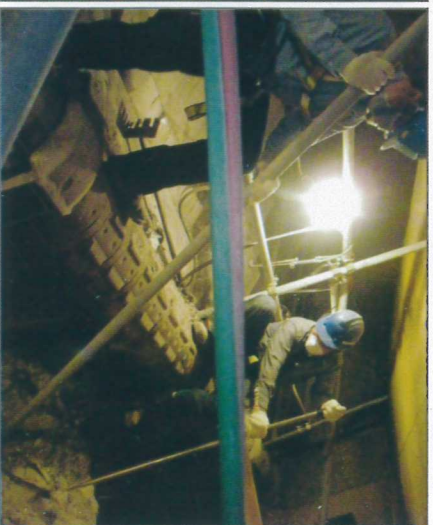
#3B爐床排渣滾軸清渣