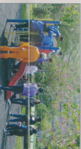
大家都發自內心的笑呵呵