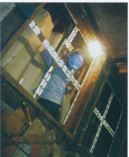
#3B袋式頂爐檢查焊補

慎始，保持健康正面的心態並盡力做好準備及計劃，即使是生手幾經磨練之後相信也能應付自如。 歲修期間的安全衛生更是不容忽視，各承包商在不同區域甚至是同一場地同時間地操作，廠區的整體安全潛在危害相對提高，因此更必須加強要求依規定執行填寫管制單等作業管控制表格，並要求配戴安全防护配備。除了雙方的安衛人員的督導，監工更必須經常注意現場作業人員及自身的安全風險，不斷提醒作業工人提高安全