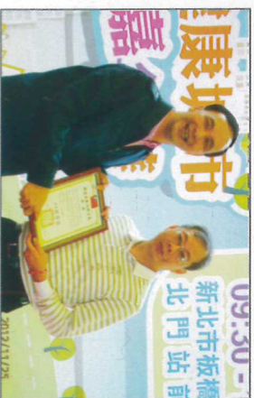
新北市政府市長朱立倫市長(左)主持頒獎典禮頒發獎狀，信鼎廖俊結總經理(右)代表公司授獎。

新北市政府於101年11月25日假板橋區火車站廣場辦理健康嘉年華表揚減重有成企業及成果展活動，並由朱立倫市長親自主持頒獎典禮，由本公司廖俊結總經理代表授獎。