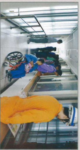
一夥人都在觀望垃圾抓斗抓垃圾(好認真)

這位弟弟從沒有搭過電梯啊??老師笑說，是啊，這算是他難得的經驗耶！我看著小男孩驚恐又好奇抓著同伴的表情，心裡真複雜啊。