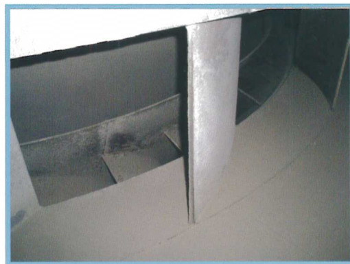
圖二 半乾式系統渦道檢查、清潔

有句大家耳熟能詳廣告詞是這樣說著：「樹頭哪顧乎再！就不怕樹尾做風颳」，而“安全”就是我們這些辛勤工作者的樹頭，哪怕你有一身鋼鐵般的好體格，都無法抵擋一次“氧乙炔”在身上掃過的危害，當然這樣的形容只是做個比喻，畢竟廠內具有危險性的工具是各式各樣，因此監工在人員執行工項前除了須確認安全護具是否齊全外，也需要清楚人員在使用具有潛在危害因子的工具時是否有按照其正確的使用流程操作；由於廠內許多的作業環境是屬於侷限空間，如半乾式渦道（圖二），主要功能為輔助廢氣流導向與化藥充分攪拌，增加化藥反應效率；袋室集塵設備（圖三），每個艙室分別由12*15個濾袋緊密排列而成，放眼望去類蜂巢式組成，於其間執行袋子及艙體結構目視檢查，自己似乎成了防制系統裏的小蜜蜂，辛勤的確認污染防治設備最後一道防線狀況，除提供化藥滯留時間協助去除廢氣中HCl及SO 2 等成份外，亦提供粒狀物、重金屬及戴奧辛等有害環境之污染物去除之工作。設備之重要性如此，檢查