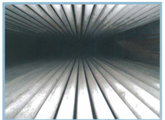
圖四 空氣預熱器清潔

燒空氣至第三煙道提供過熱器管熱能交換產生過熱蒸汽後，導引至汽機以提供廠內收入來源。故其清潔程度亦重要非常，且其完整度對爐控手來說，如人飲水冷暖自知；而因為內部管排的排列密集，使積灰的形成異常厚實，自身亦具備有爐控手的身份，深知該工項之重要性，對於此重要又艱難的工作，自己自有秉持一步一腳印的態度，堅守現場與工作人員同舟共濟，將管排一根一根的處理且花了整整五天的時間，才得以水到渠成讓長官點欣然接受。