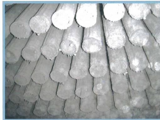
圖三 袋室集塵器蜂巢式排列之濾袋

保養工作之重要性亦相對提升；然任何工作之首以安全為第一考量，故在監管的方面需要確實的記錄工作人員的進出人數，避免有人員因不可抗拒的因素而停滯在空間內，造成日後極大的遺憾；廠內長官要求，工作的執行需建築於安全的環境下，不得有絲毫退讓。在長官耳提面命的驅駛下，同仁們皆可了解安全無虞的工作環境是大家的第一目標，唯有確認所有工作皆可安全執行，該工作才有執行的必要與意義。