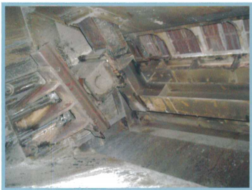
圖一 爐床作動元件

在歷經一次歲修後，已在公司服務屆滿一年的我，雖然對廠內的眾多設備及其功用與流程有了初步的認知，但對設備內部的構造及廢氣的流向卻常有著“知其然，不知其所以然”的感觸，畢畫許多設備是24小時不停歇的運作著，想要對內部的構造一窺究竟還真不是常有的機會，例如爐床作動元件（圖一），金屬節、軸環環相扣，窺視內部結構雄偉壯觀，與無敵鐵金剛內部不分軒輊。101年度基隆廠上半年的歲修經由組長的指派接了清潔監工一職，對於這樣的調度我的內心只能用“誠惶誠恐”來形容，監工要做些什麼？讓我來做會不會影響到公司的營運？想到這些就讓我每天憂心忡忡；對於參與生平第二次的歲修，便擔任起清潔監工，讓我更加戰戰兢兢的面對每一件工項的執行，