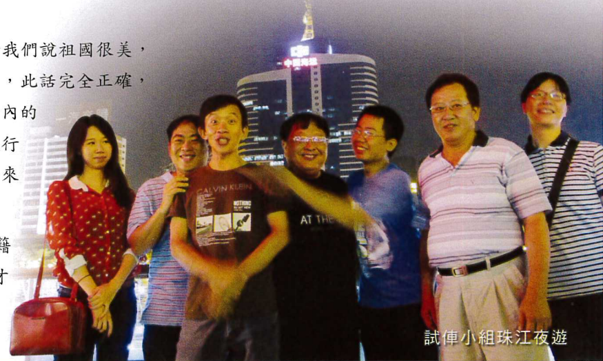
試車小組珠江夜遊

2013年9月底，廣州試車工作暫告一段落。組織所有台籍人員到KTV去答謝那些一路走來一同“甘苦”的陸籍專工、工作夥伴。在工作上因文化與價值觀差異，過程中我們跟他們有著許多衝突、不愉快跟角力，但畢竟都順利走完試車階段。聚會尾聲，號召所有台籍員工，大家不計前嫌的向他們致上謝意，謝謝他們給我們這機會看見自己的不足跟能耐，也讓我們發現，原來我們也可以在海外組織一個這麼優秀的焚化廠建設工程與試車管理團隊。