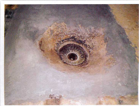
燃燒器耐火泥塗覆