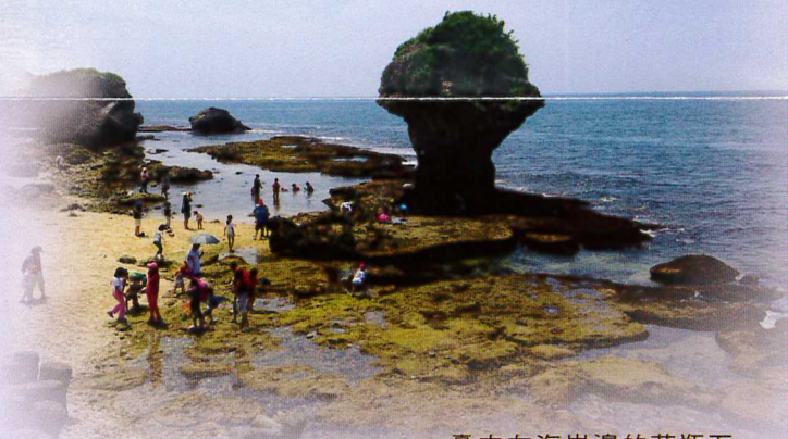
矗立在海岸邊的花瓶石

小琉球島為珊瑚石灰岩之分布地形，島上四處洞穴地形遍布，不論陸上或是水裡都蘊含了豐富的自然資源，可以看到遊客們在水平面上載浮載沉，探索海裡的生態，既然來了著名的景點一定要去巡禮。