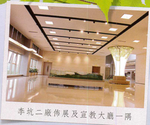
李坑二廠佈展及宣教大廳一隅

廣鼎成立接近三年時間裡，在信鼎全力技術支持及結合當地人力共同努力下，服務工作佈及焚燒廠建設過程中報建報批/審查/設計及建設管理/調試服務等工作，而階段性前來支援的十餘位同仁更貢獻了所學，甚至將未曾有經驗之建設管理潛在學能都在李坑二廠建設過程中發揮得淋漓盡致，成果普獲業主及廣州市政府各級單位一致好評，也對此兩岸合作模式深感認同；惟這過程是艱辛的，相信所有曾經來過的長官、同仁都深刻感觸，到這裡，不管做事方法、制度、管理、規章，甚或權責認知等，在與台灣不同，我們無法評斷對與錯，更難一語道盡其中，但在這段經歷裡，我們踏踏實實的上了一課，深入且確實體驗學習到不同的行事邏輯及許多非技術面關係的運用技巧，這些都是在台灣學習不到更無法體會的；且如此全過程接觸中，相信同仁也累積了個人在公司未來立足其他據點之基石與職能資產。