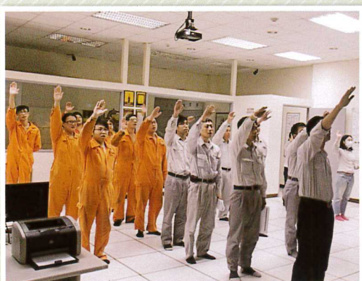
主題一：檢討過去、展望未來 (由廠長帶領安全宣示)