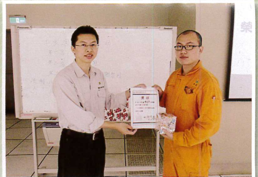
主題五：工安學堂由廠長頒獎