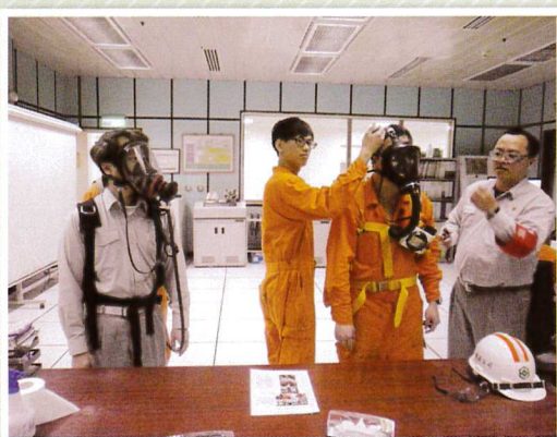
主題四：局限空間危害預防及SCBA教導